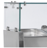
Glazen structuur voor bescherming van voedsel