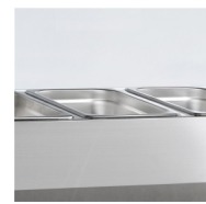
Geschikt voor GN1/3 bak(ken) (niet meegeleverd)