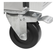
Sterke wielen als optie