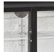
Deurstop voor vullen van de kast