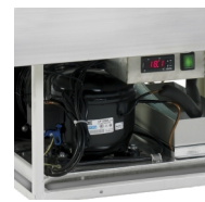
Automatische verdamping van dooiwater