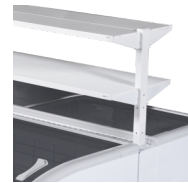
Promotionele planken als accessoire