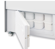
Goed toegankelijk opbergvak