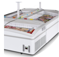
Eilandopstelling, planken als accessoire