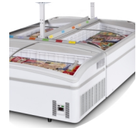
Eilandopstelling, planken als accessoire