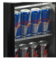
Ontworpen voor Energy-cans