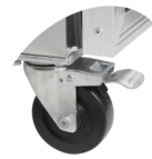
Zwenkwieien met en zonder rem