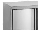
Leverbaar zonder opkant