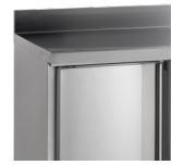
Leverbaar met opkant