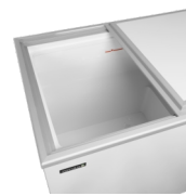
Platte dichte schuifdeksels