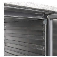
Geleiders voor pizzaladen