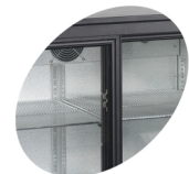
Deurstop voor vullen van de kast