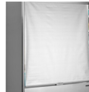
Nachtblindering / gordijn met zachte ontspanning