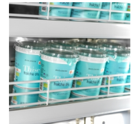
Instelbare planken met kantelfunctie