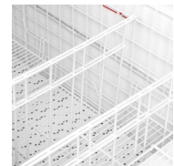
Verstelbare valse bodem