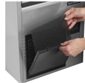
Gemakkelijk te reinigen condensfilter