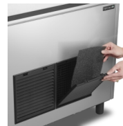
Gemakkelijk te reinigen condensfilter