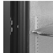
Deurstop voor vullen van de kast