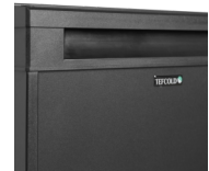
Ingebouwde greep voor elke functie