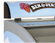
Verlicht displaybord als optie (als accessoire verkrijgbaar)