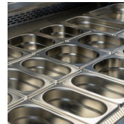
Ontworpen voor GN1/1 bakken (niet meegeleverd)